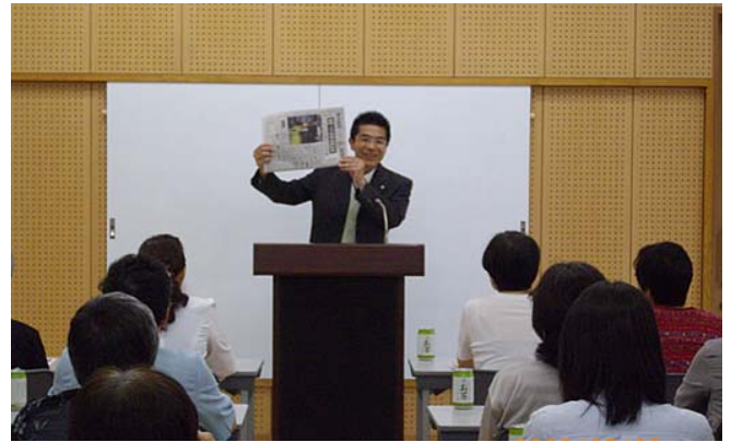
〈7月25日：県政報告会（若久校区）〉 記録的な大雨が続く中、たくさんの方々に お集まりいただきありがとうございました。