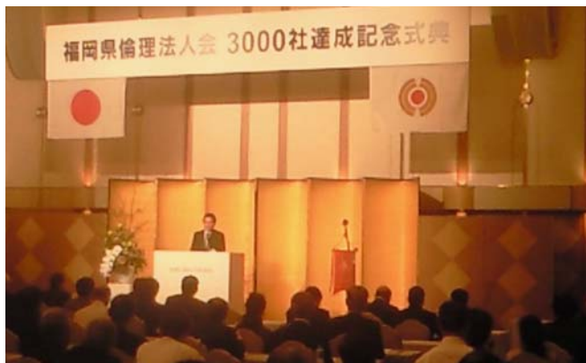
〈8月4日：福岡県倫理法人会3000社達成記念式典〉 私は、福岡市南倫理法人会の会長をしています。