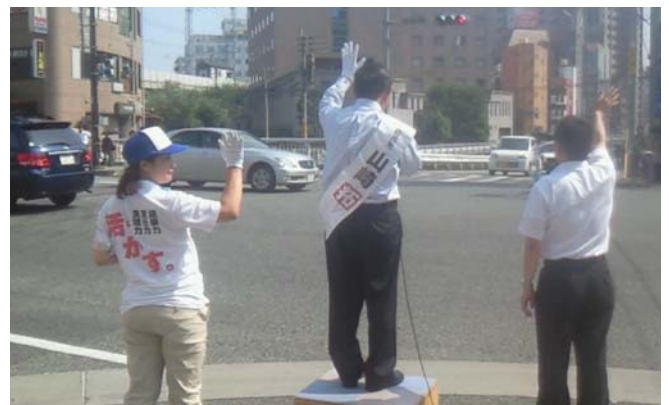
〈8月29日：山崎拓前代議士街頭演説〉 選挙は残念な結果になりましたが、 多くの皆様のご支援ありがとうございました。