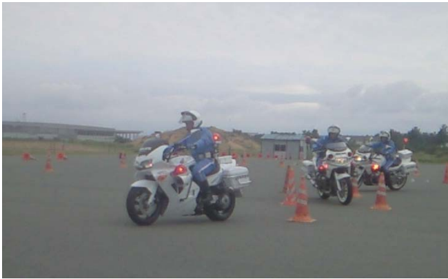
〈9月8日：自転車運転訓練場視察〉 警察委員会で福岡県警察自転車運転訓練場を視察しました。 警察の皆さん頑張ってください。