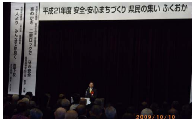
〈10月10日：安全・安心まちづくり県民の集い〉 地域の防犯に携わる皆様方の大会に参加しました。 安全・安心な社会を作る為に皆様のさらなる ご活躍をご期待します。