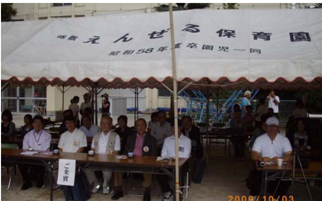
〈10月3日：保育園運動会〉 10月は地域の体育行事が目白押しでした。 幼稚園・保育園の運動会では子ども達の元気な姿に感動しました。