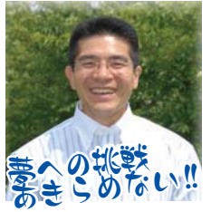
夢の地を へきこのめ の地を へきこのめ

議員 明 誌 会選 ち 議選 会 区選 会 福 南 後 岡 区 援 ( 南 ) 会