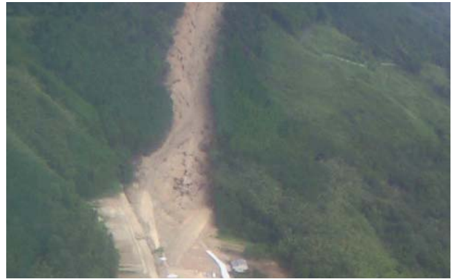
〈9月8日：7月の豪雨の被災地視察〉 写真は福智町の被災現場です。 土砂崩れの大きさを物語っています。 被災された皆様に心からお見舞い申し上げます。